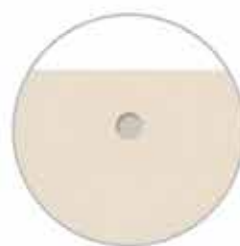
Previsto foro a scomparsa per appendere