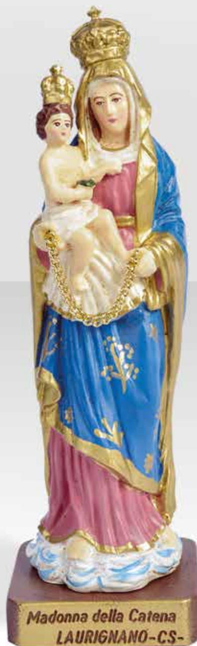
ST20.1 H: 20 cm