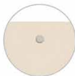
Previsto foro a scomparsa per appendere