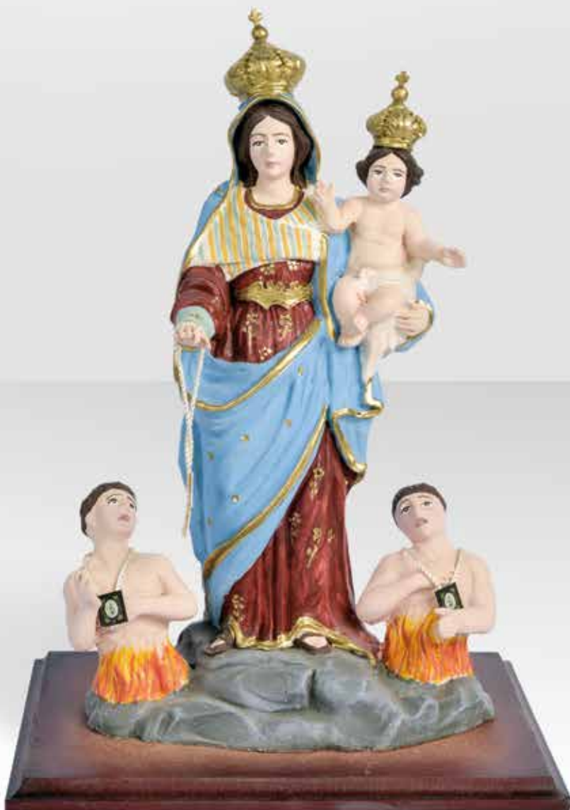
ST20.3 H: 20 cm

*Previsto costo modello iniziale. Vista l'artigianalità del prodotto le colorazioni vanno confermate.