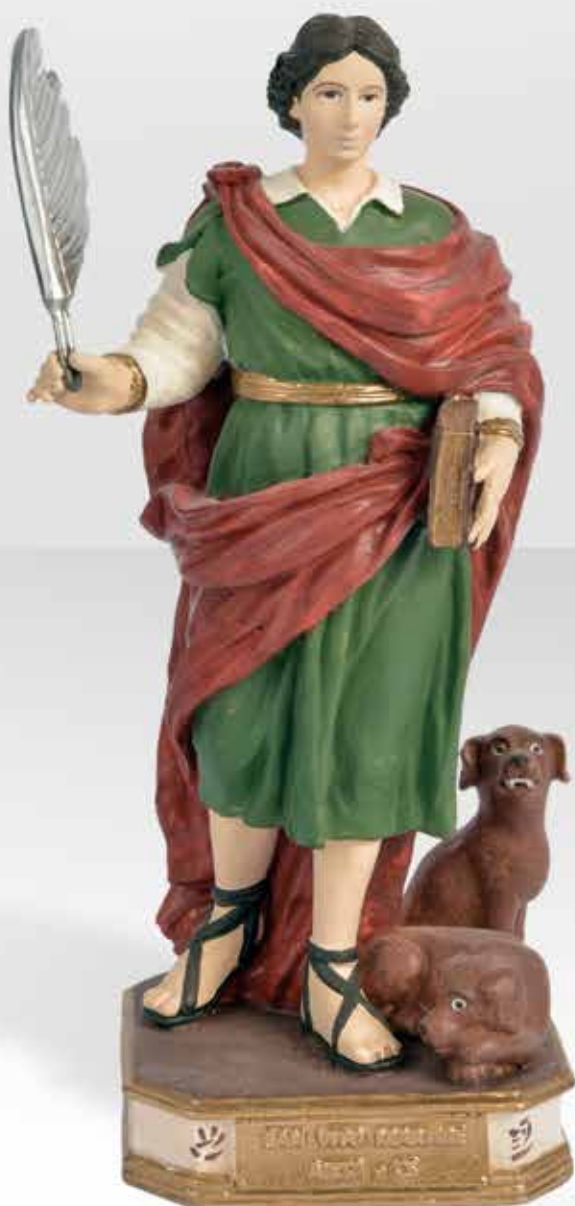
ST20.2 H: 20 cm

*Previsto costo modello iniziale. Vista l'artigianalità del prodotto le colorazioni vanno confermate.