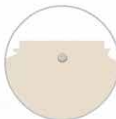
Previsto foro a scomparsa per appendere